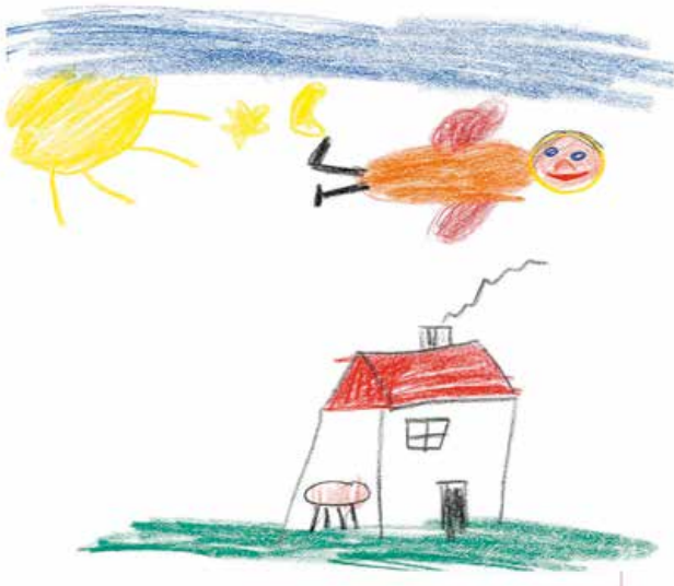
Gott ist im Himmel – aber den Menschen nahe

Ein einfaches Beispiel: In der frühen Kindheit sind es oft Bilderbücher, die unsere Vorstellungen von den Menschen und ihrer Welt beeinflussen oder gar prägen. Doch bald erkennen wir, dass der Großvater im Bilderbuch nicht der ist, der uns besucht und mit uns spielt. Die Wirklichkeit, die wir erleben, ist eine andere als die in der Begegnung mit Bildern oder Geschichten. Hinzu kommt die Tatsache, dass unsere Wahrnehmungen und Erkenntnisse immer bruchstückhaft bleiben. Dies gilt auch für unsere Vorstellungen und unsere Sprache, wenn wir uns Gott vergegenwärtigen oder von ihm reden. Wir können uns nur über unsere Erfahrungswelt und Sprache, über Bilder und Symbole sowie die biblische Überlieferung eine Vorstellung machen von Gott. (Dies darf nicht verwechselt werden mit dem alttestamentlichen Verbot, von Gott Bilder anzufertigen. Dieses Verbot – siehe das erste der Zehn Gebote – war u.a. wichtig geworden, um sich von heidnischen Bräuchen und Götzendienst deutlich zu distanzieren. Vgl. Katechismus der Neuapostolischen Kirche, Kap. 5.3.2.5 und 5.3.2.6)