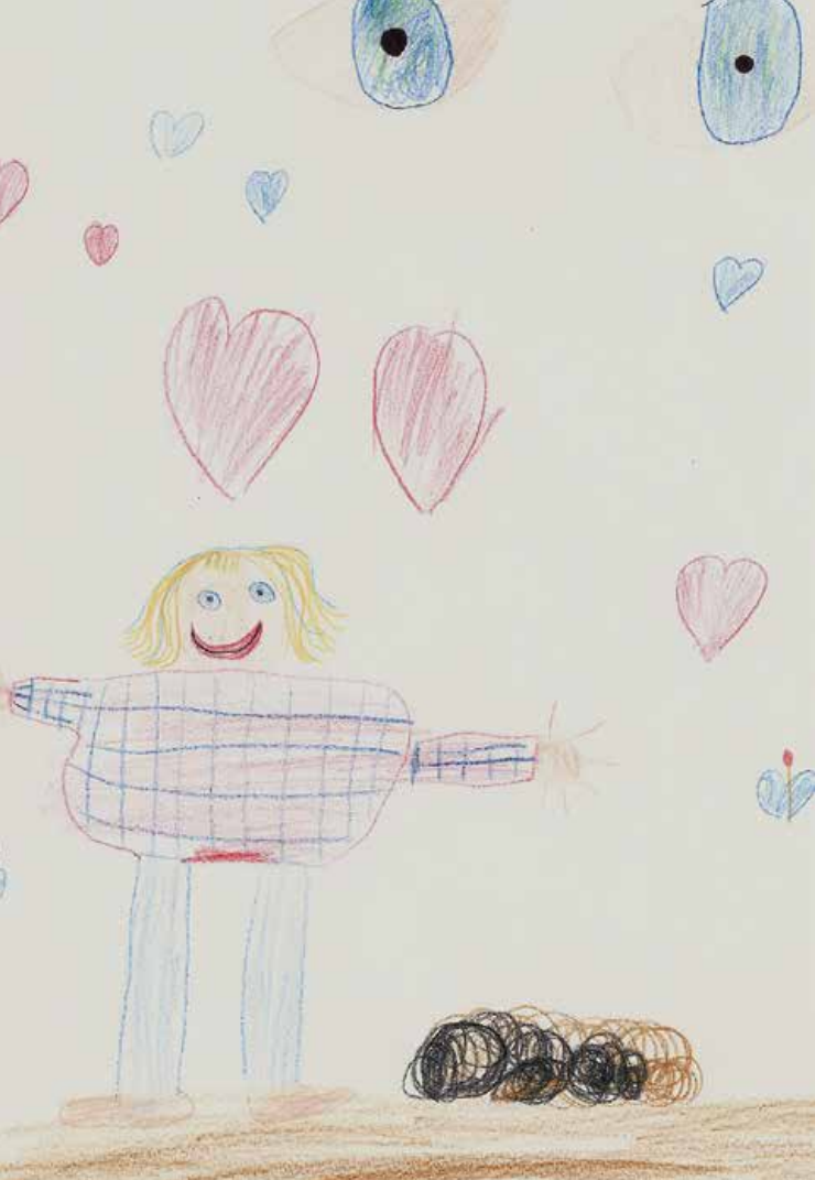
Gottes Augen schauen in Liebe aufs Kind