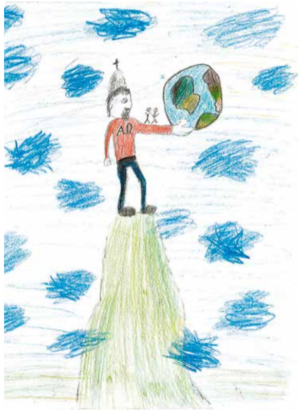
Gott ist erhaben – er hält die Welt und die Menschen in Händen (Beginn einer abstrakten Gottesvorstellung)

In Jesus Christus ist Gott Mensch geworden und in Jesus und der Wirksamkeit des Heiligen Geistes zeigt uns Gott anschaulich, wie wir ihn uns vorstellen dürfen, wer er ist und wie er zu uns steht, was wir lieben und was wir hoffen dürfen.