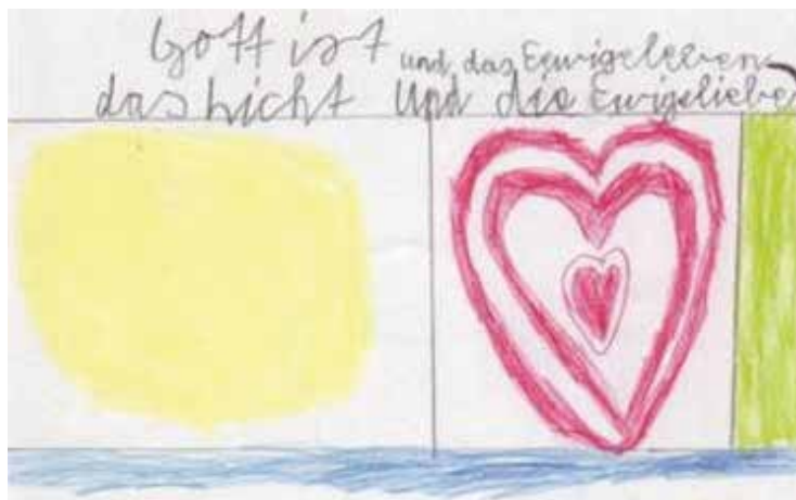
Gott, von einem Religionsschüler mit Symbolen dargestellt

Was wir über ihn, den Sohn Gottes, wissen, ist auch der beste Schlüssel für unser eigenes Gottesbild.